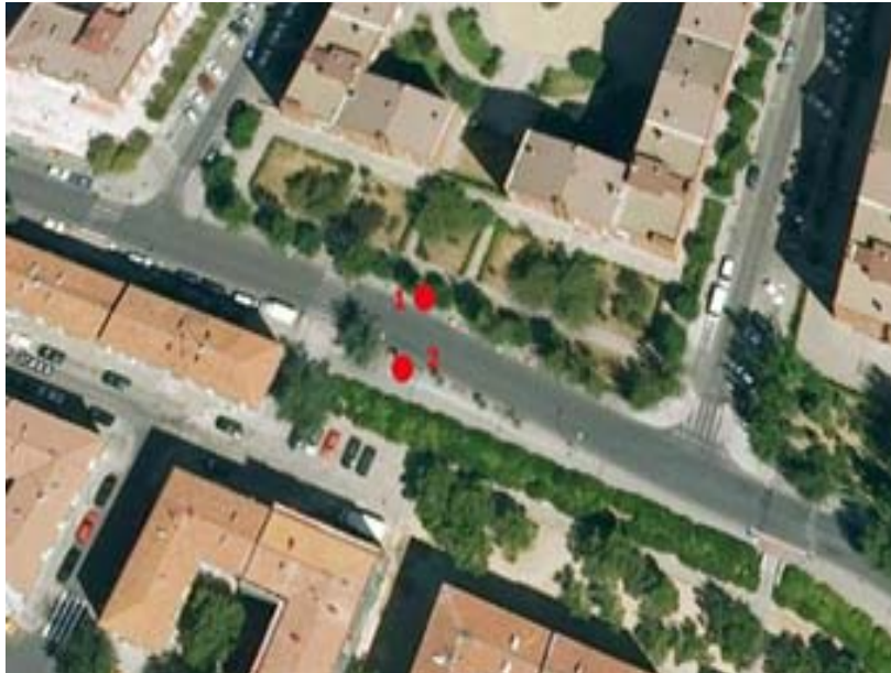
Poste 1: N10 dirección Cibeles | Poste 2: N10 Dirección Palomeras