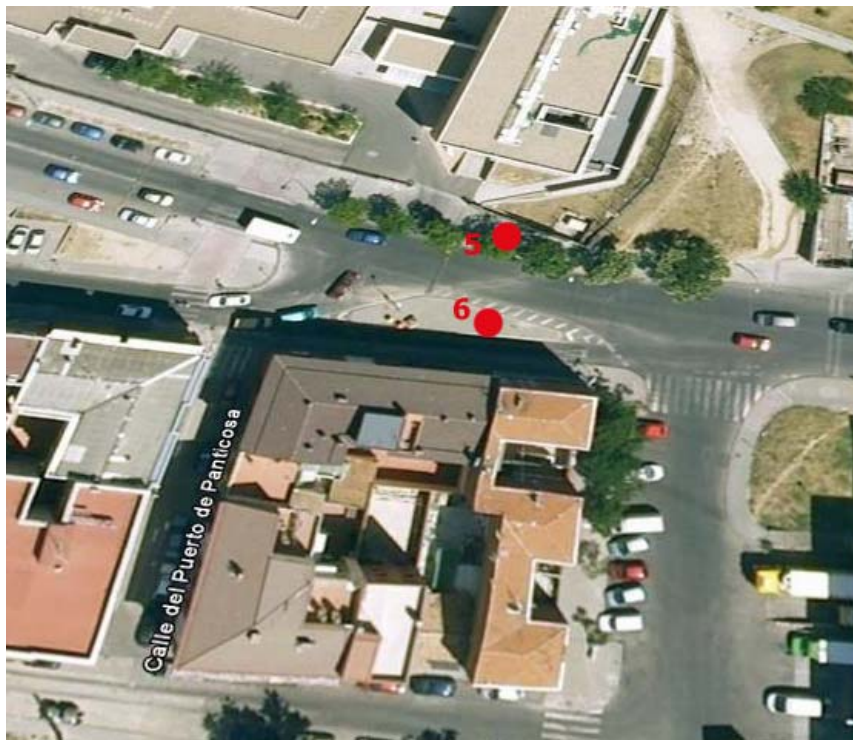
Poste 5: N10 Dirección Cibeles | Poste 6: N10 Dirección Palomeras