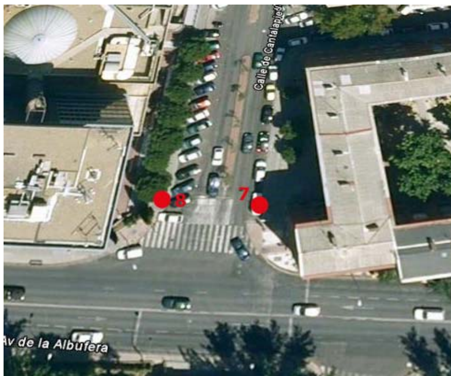
Poste 7: N10 Dirección Cibeles | Poste 8: N10 Dirección Palomeras