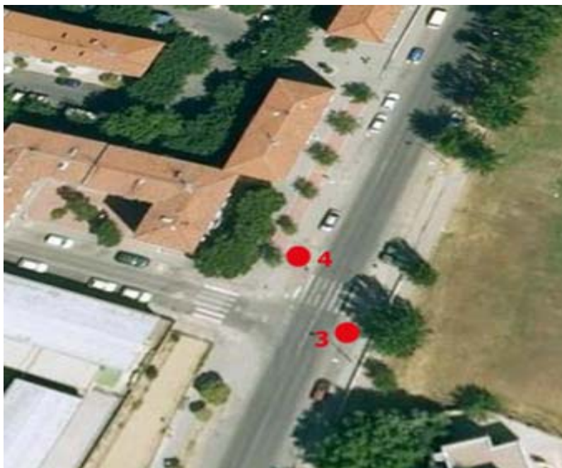
Poste 3: N10 Dirección Cibeles | Poste 4: N10 Dirección Palomeras